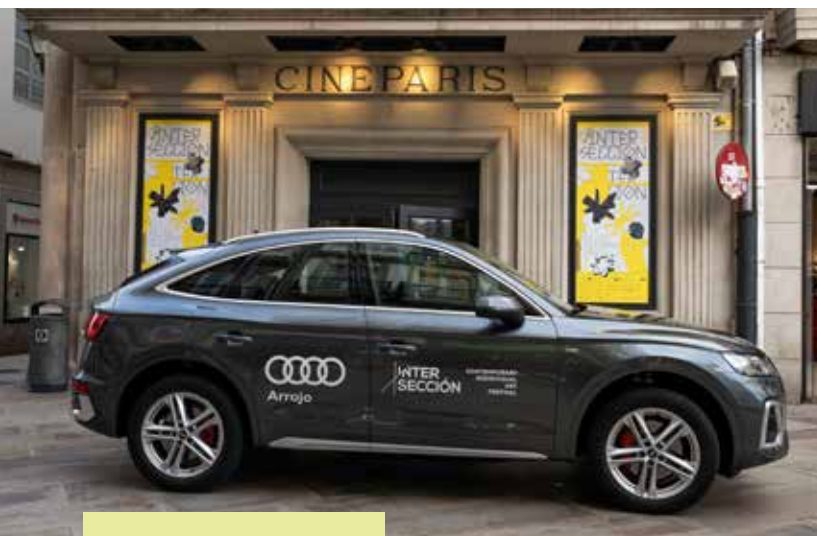
Vehículos híbridos para transfers no Intersección, A Coruña, 2022.

No ámbito do transporte e a mobilidade, o 100% dos festivais traballa con aloxamentos achegados aos recintos das actividades para fomentar o desprazamento a pé das persoas asistentes. O 90% prioriza o tren sobre o avión nas viaxes de artistas, e o 73% colabora con empresas de transporte público e fomenta os desprazamentos compartidos entre as persoas dos equipos de produción. No outro extremo, só o 17% emprega vehículos eléctricos para os desprazamentos durante o evento e só o 8% fomenta o uso da bicicleta entre o equipo de produción.