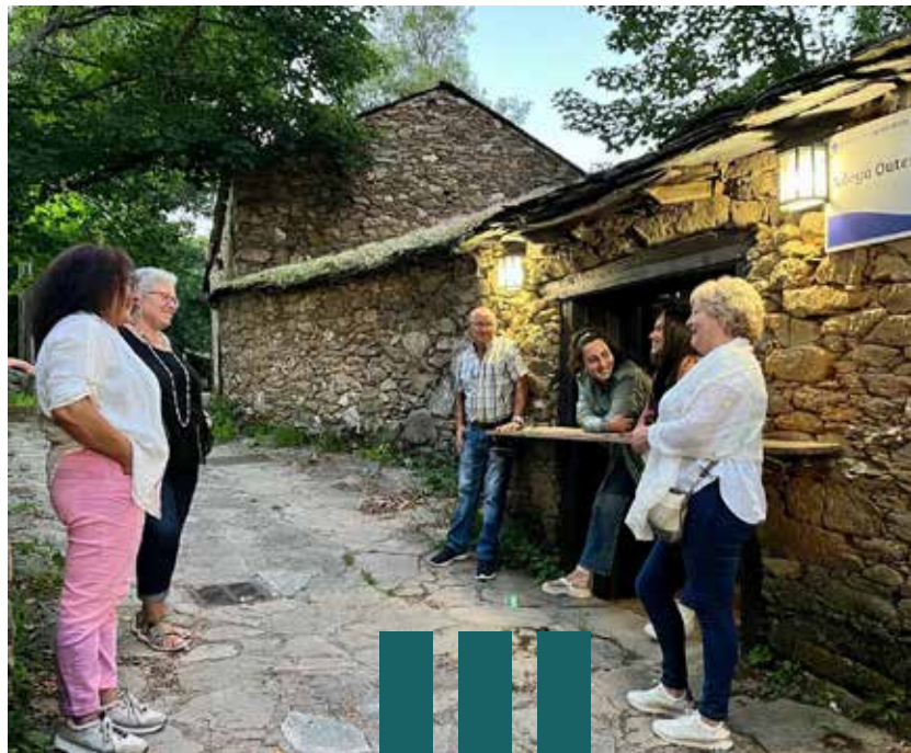
Colaboración coas adegas da contorna, FanCine de Lemos, 2022.

Só o 8% dos festivais dispón dun cadro de medición de indicadores e apenas o 17% leva a cabo a medición de indicadores de sostibilidade. Respecto ao apoio local, o 100% colabora con entidades o asociacións galegas, e o 73% contrata a artistas locais. O 90% dos festivais identificaron os seus grupos de interese, pero só un 8% mantivo reunións específicas con algún destes grupos sobre a estratexia sustentable. Rematamos este bloque preguntando polas causas que motivaron a non-implantación de certas accións, os resultados obtidos: o 31% foi por falta de coñecemento, o 19% por falta de orzamento, o 8% por falta de tempo, o 4% por falta de persoal e o 38% por outras causas.